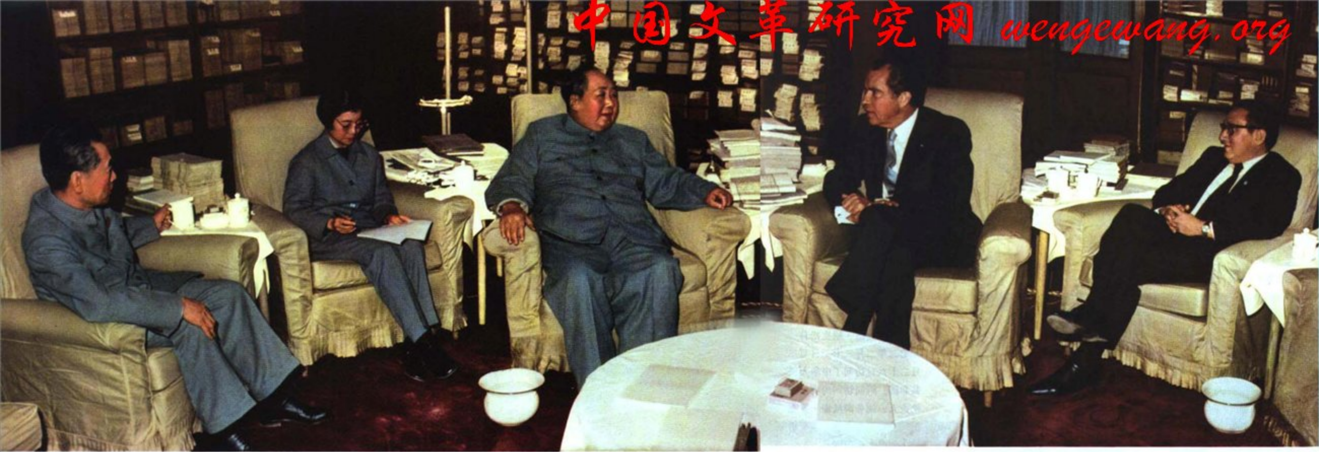
毛泽东主席在中南海会见美国总统理查德·尼克松，同他进行了认真、坦率的谈话。美国方面参加会见的，有总统国家安全事务助理亨利·基辛格博士。中国方面参加会见的，有国务院总理周恩来，外交部礼宾司副司长王海容和翻译唐闻生。