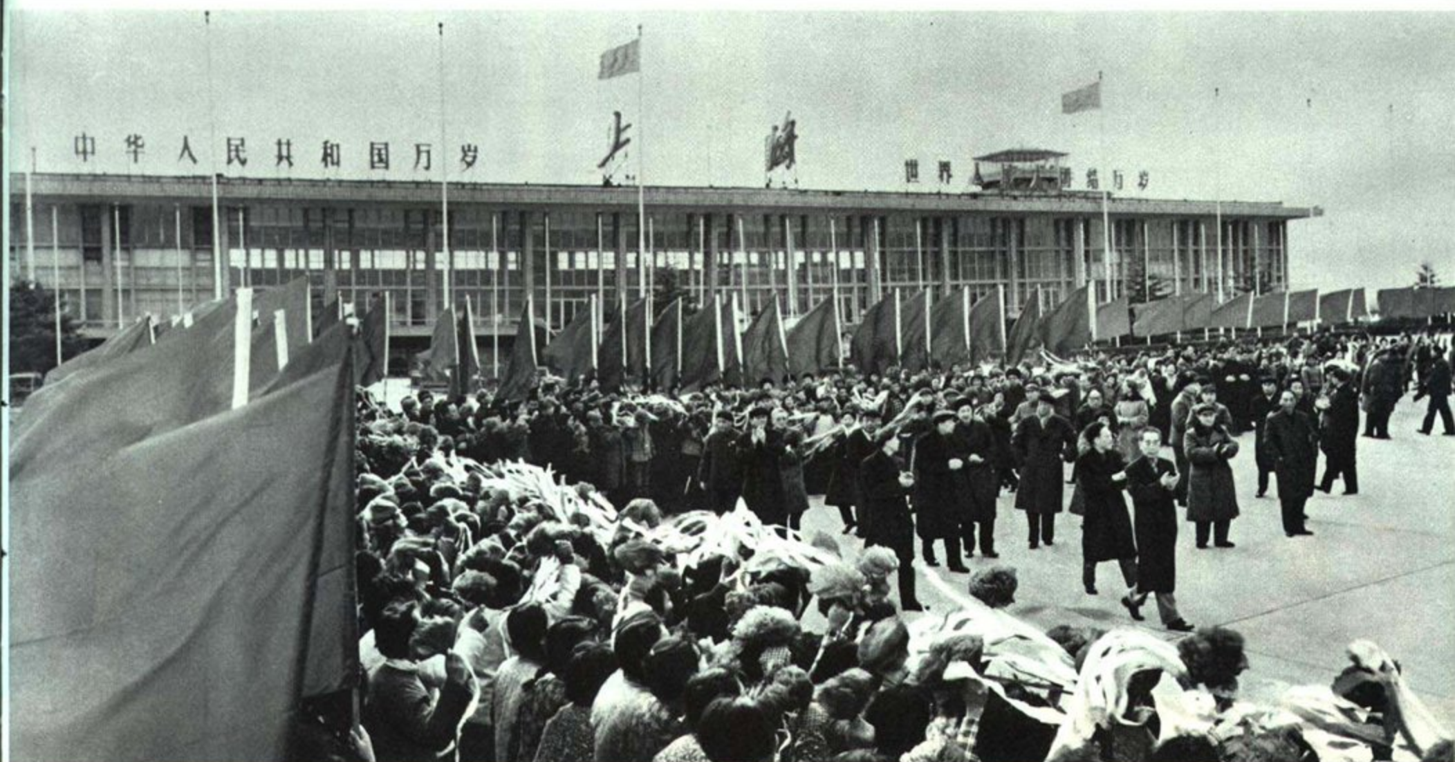
国务院总理周恩来等同志二月二十九日离开上海返回北京。中共中央政治局委员、中共上海市委第一书记、上海市革命委员会主任张春桥和中共上海市委、市革委、人民解放军驻上海部队等有关方面负责人，以及群众三千多人前往机场热烈欢送。