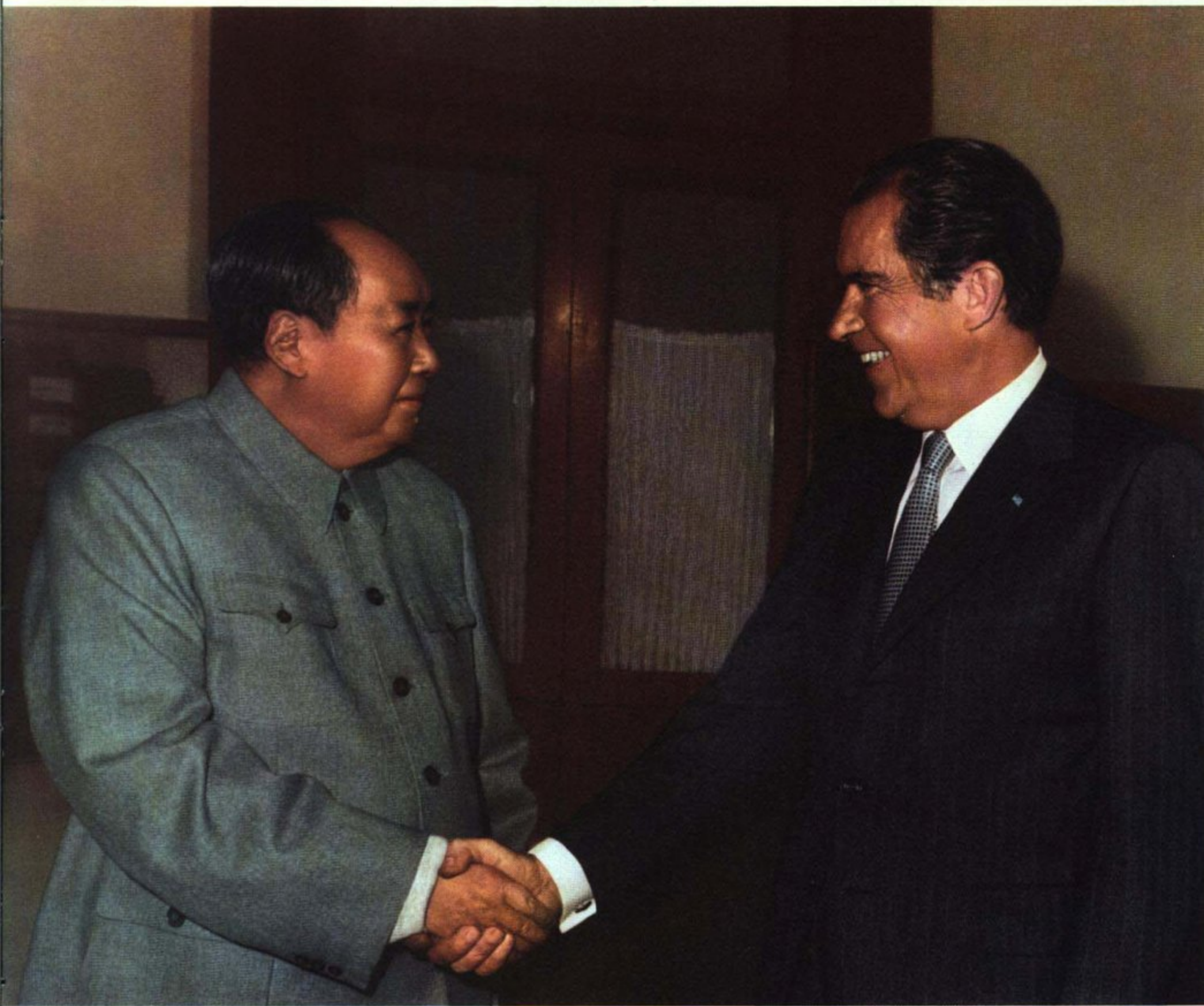
毛泽东主席会见理查德·尼克松总统。