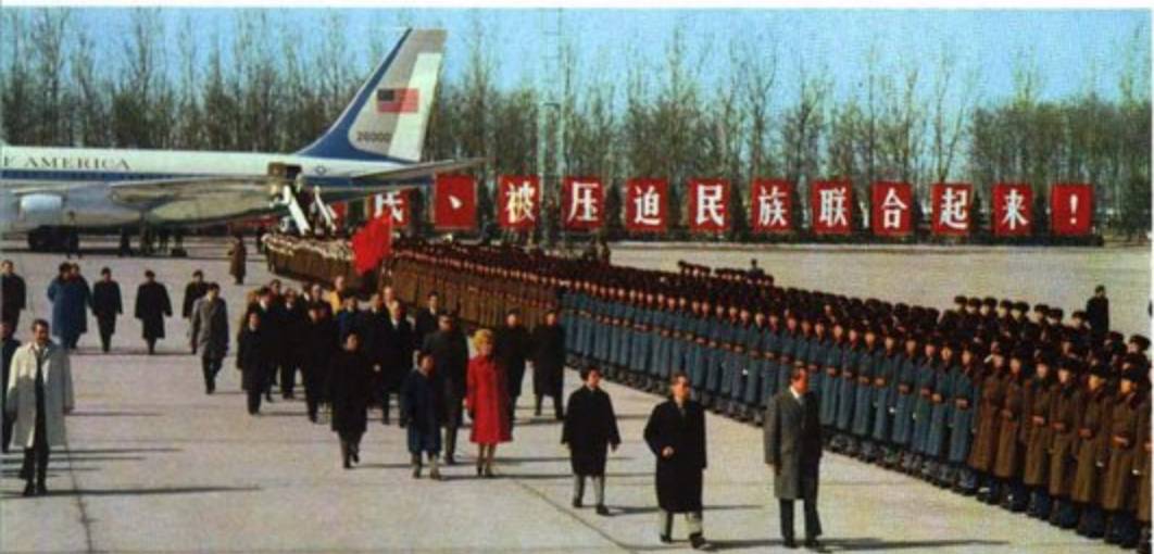
美利坚合众国总统理查德·尼克松，应中华人民共和国总理周恩来的邀请前来访问，二月二十一日到达北京。上图：周恩来总理和尼克松总统在机场握手。下图：尼克松总统由周恩来总理陪同检阅中国人民解放军陆、海、空三军仪仗队。