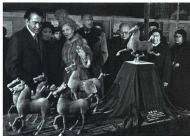
尼克松总统和夫人一行，参观在无产阶级文化大革命期间出土的历史文物。