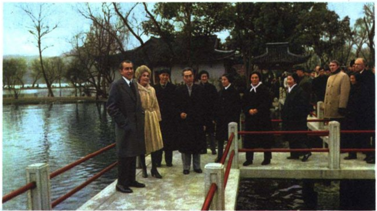
尼克松总统和夫人一行由国务院总理周恩来、浙江省革命委员会主任南萍等陪同，游览了杭州西湖。