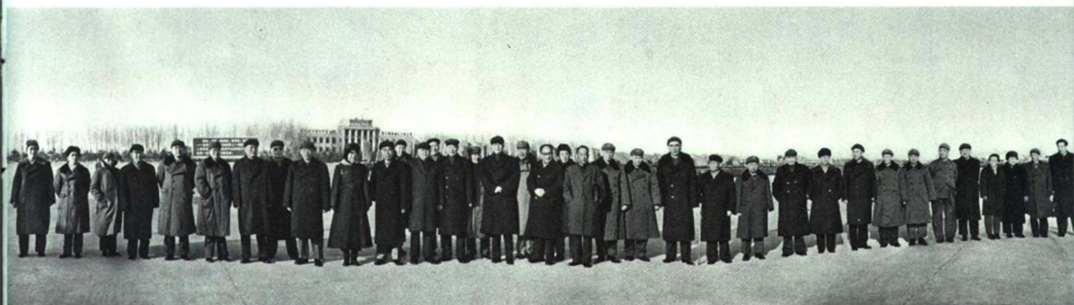
国务院总理周恩来，外交部部长姬鹏飞、副部长乔冠华，陪同美国总统尼克松访问我国南方以后，二月二十九日从上海回到北京。首都群众、中国人民解放军指战员和民兵共五千多人前往机场热烈欢迎。中共中央政治局委员江青、叶剑英、姚文元、李先念，中央政治局候补委员纪登奎、李德生同志等，前往机场欢迎。这是在机场合影。