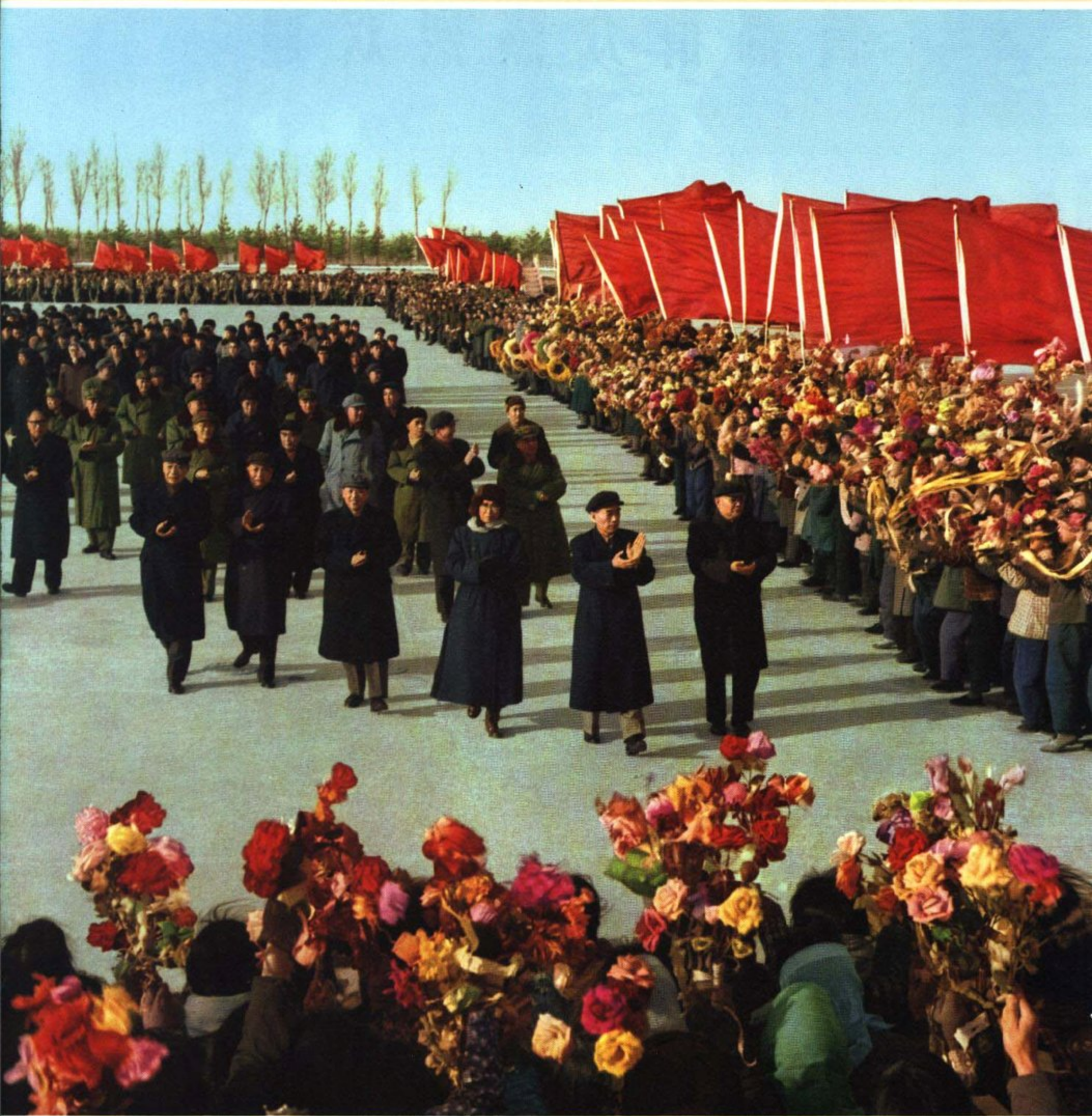
周总理等从上海回到北京，首都群众五千多人前往机场热烈欢迎。