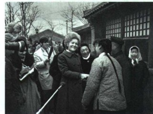
尼克松总统夫人参观北京四季青人民公社，并访问了社员家庭。