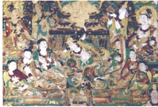
图 3 隋代《献花伎乐飞天》