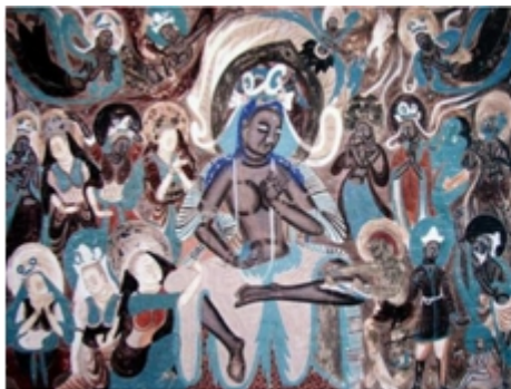
图1 北魏《尸毗王本生》

北魏时期的飞天，西域风格是主流，但具体形象上已流露出中原之风。西魏的飞天洞窟，窟顶绘有道教诸神，有羽人、雷公、电母、雨神等诸神，另有伏羲、女娲等均人面蛇身，展示了中国传统的天地宇宙观念。