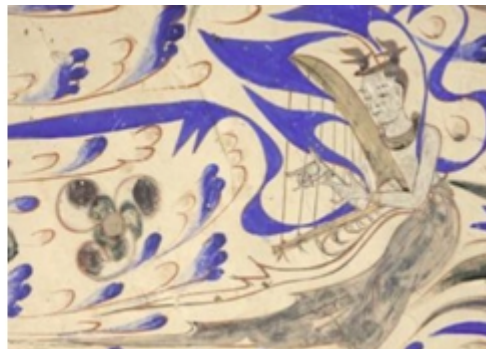
图2 西魏《弹箜篌飞天》